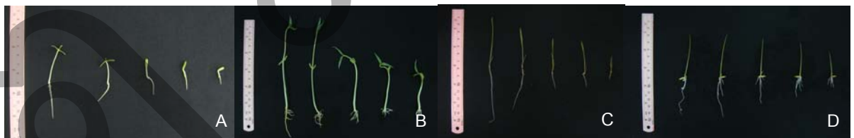
Figure 2 Effect of rice straw extract which concentrations are 0.00, 1.25, 2.50, 3.75 and 5.00 g/l from left to right on giant mimosa (A), mung bean (B), rice (C) and barnyard grass (D).

จากการศึกษาผลของสารสกัดจากฟางข้าวพันธุ์ชัยนาท 1 ที่ความเข้มข้น 0.00, 1.25, 2.50, 3.75 และ 5.00 กรัมต่อลิตร ต่อการงอก ความยาวยอด และความยาวรากของต้นกล้าไมยราบยักษ์ ถั่วเขียว หญ้าปล้อง ละครمان และข้าว พบว่าสารสกัดจากฟางข้าวทุกความเข้มข้นไม่มีผลต่อเปอร์เซ็นต์การงอกของพืชทดสอบทุกชนิด แต่มีผลในการยับยั้งความยาวยอดและความยาวรากของพืชทดสอบ โดยในการทดลองนี้พบว่าสารสกัดมีผลต่อทั้งพืชใบเลี้ยงเดี่ยวและใบเลี้ยงคู่ ซึ่งสอดคล้องกับการทดลองของ Chung et al. (2003), Eban et al. (2001) and Kawaguchi et al. (1997) ที่พบว่าสารสกัดจากส่วนต่างๆ ของข้าวมีฤทธิ์ในการยับยั้งการเจริญเติบโตของทั้งพืชใบเลี้ยงคู่และพืชใบเลี้ยงเดี่ยว โดยพบว่าสารสกัดจากใบ และลำต้นของข้าวมีฤทธิ์ยับยั้งความยาวรากของผักกาดหอม ( Lactuca sativa L.) และ Heteranthera limosa (Sw.) Willd. และสารสกัดจากฟางข้าวมีฤทธิ์ยับยั้งการเจริญเติบโตของต้นกล้าผักเขียว ( Monochoria vaginalis (Burm. f.) C. Presl & Kunth) และหญ้าปล้องละครมาน ( Echinochloa crusgalli (L.) Beauv.) และพบว่าเมื่อสารสกัดมีความเข้มข้นเพิ่มขึ้น สารสกัดสามารถ ยับยั้งความยาวยอดและความยาวรากได้มากขึ้น (Table 2, Figure 2)