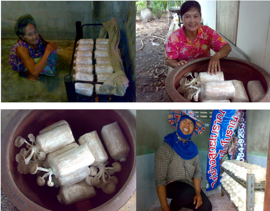
ภาพที่ 2 กลุ่มผู้ร่วมเรียนรู้ใช้ความรู้ที่ได้จากการอบรมเชิงปฏิบัติการไปประยุกต์เพื่อเพาะเห็ดนางฟ้าสำหรับบริโภคในครัวเรือน