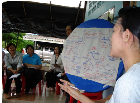
เวทีเพื่อค้นหาศักยภาพ ปัญหา แนวทางแก้ไข