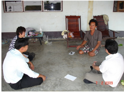
การเรียนรู้ จัดเก็บ วิเคราะห์ข้อมูลเชิงคุณภาพ

กระบวนการที่เปิดโอกาสให้ชุมชนและนิสิตได้แลกเปลี่ยนเรียนรู้ร่วมกันเพื่อการเปลี่ยนแปลง ดังภาพที่ 2