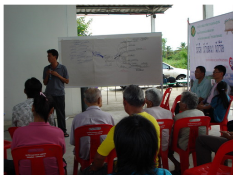
การจัดเวทีสะท้อน ทบทวนการเรียนรู้ร่วมกัน