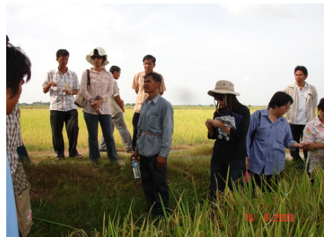
เรียนรู้จากชาวนาที่เป็น Best practice