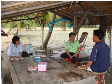
การติดตามสะท้อนการเรียนรู้