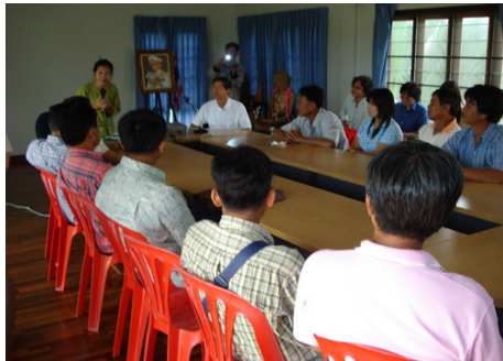
การค้นหาคำรู้ใหม่ๆ ณ มูลนิธิข้าวขวัญ