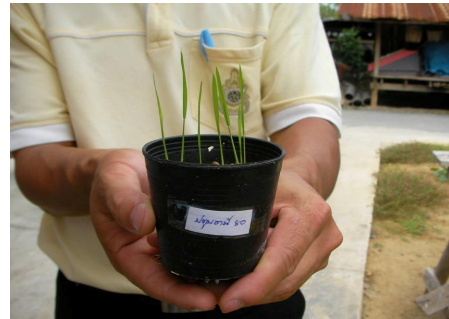
การทดลองเพาะข้าวตามแนวทางมูลนิธิข้าวขวัญ