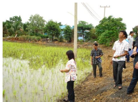
ชาวนาทดลองปลูกข้าวด้วยวิธีโยนตุ้มข้าว